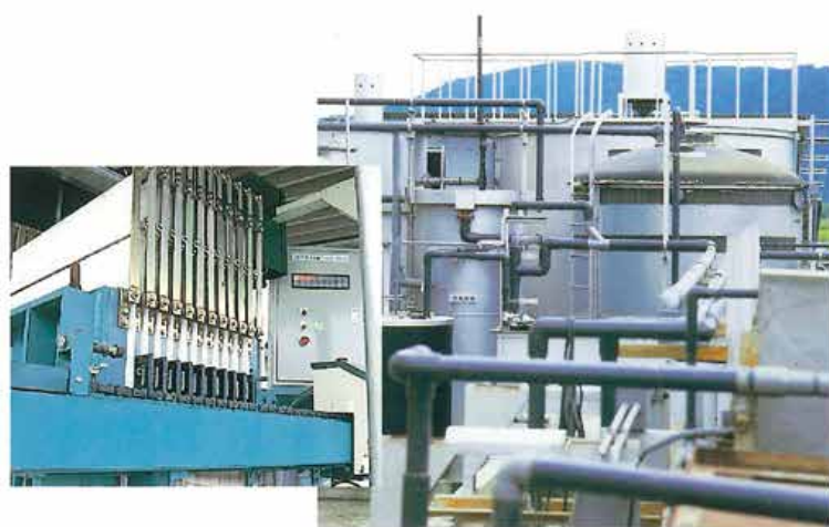
総合排水処理装置

大津電機工業株式会社は、平成14年8月28日付けで、環境マネジメントシステムの国際規格ISO14001認証を取得しました。